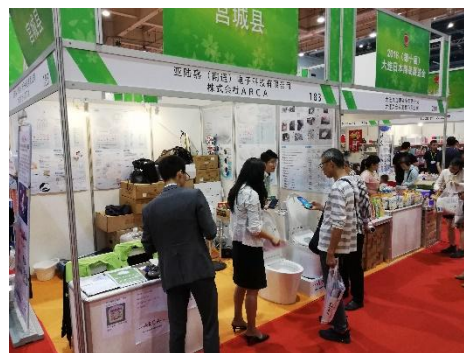
县内企业展位情况