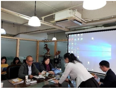
针对旅行社的推广销售活动