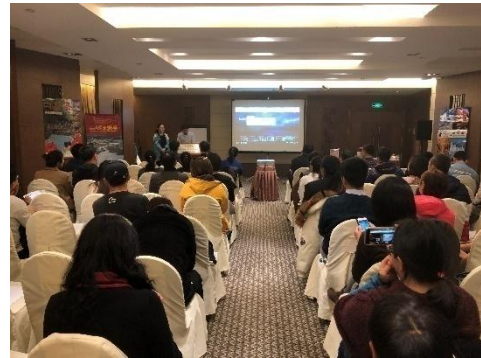
東东北地区滑雪度假说明会

在大连地区，日本北海道及长野县的雪场有着较高的知名度，今后将对此进行有针对性的宣传以吸引更多的滑雪爱好者前来日本东北一游。