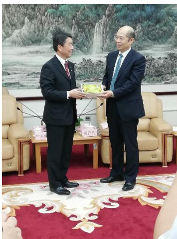
村井知事与谭书记

而在参加活动之前，村井知事还与仙台国际机场株式会社的岩井社长一同访问了中共大连市委书记谭作钧及大连市长谭成旭，双方就尽早复航“仙台-大连”航线一事进行了深入会谈。