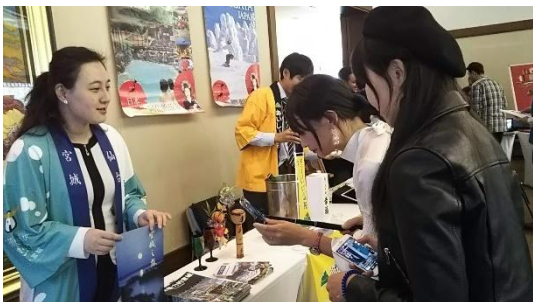
向来场宾客介绍推广宫城

本所除大使馆举办的活动外，还参加了广州、沈阳总领馆及大连领事办公室主办的2018年天皇诞辰活动，并在会场推广介绍了宫城县。