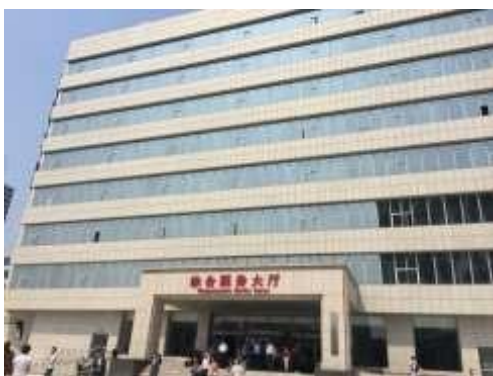
一站式综合办事大厅