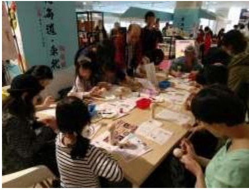
偶人彩绘体验现场情况