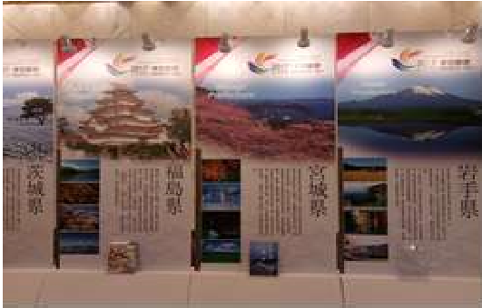
会场布置的自治体宣传板

宫城县方面有来自国际经济·观光局的高砂义行局长出席会议，对宫城县概要及观光资源进行介绍的同时，还提议进一步促进交流机制的建设。