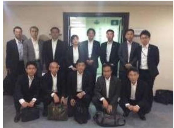
七十七银行支店长研修团全员

作为本所，通过 DVD 向各位研修团员介绍了大连市概况，加深了其对于大连市整体概况的理解。