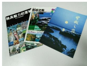
于劳动公园介绍宫城县