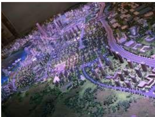
沈阳自贸区大连片区沙盘