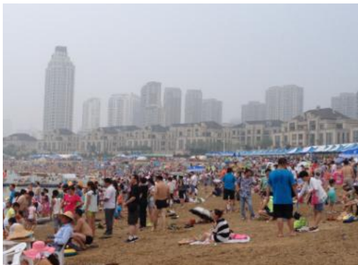
人头攒动的星海公园海滨浴场

大连国际啤酒节每年都在大连最佳旅游季节（7月下旬至8月上旬）期间举办。借此良机一览美丽的旅游都市大连也不失为一个好主意。