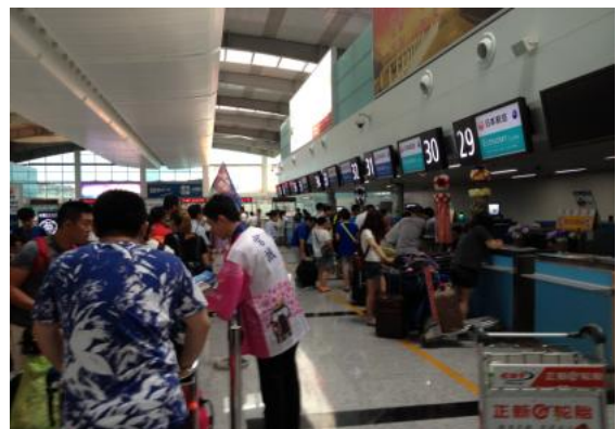
被七夕挂饰装扮一新的国际办柜台

举办活动的两天中除了向中国乘客发放中文版宫城县宣传册外，还为日本旅客准备了日文版宣传册，并在发放时宣传推广了“夏日游”活动，以期在夏休期间吸引更多游客前来。