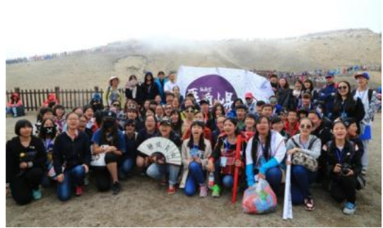
连远方台阶也站满了热情的读者

在多方努力筹措下，8 月 17 日当天长白山迎来了 2 万 3 千余人的到访，根据当地报纸的报道，由于团体及个人游客申请爆满，甚至导致 8 月 15 日至 17 日期间的电子客票预约及销售服务一度中断。