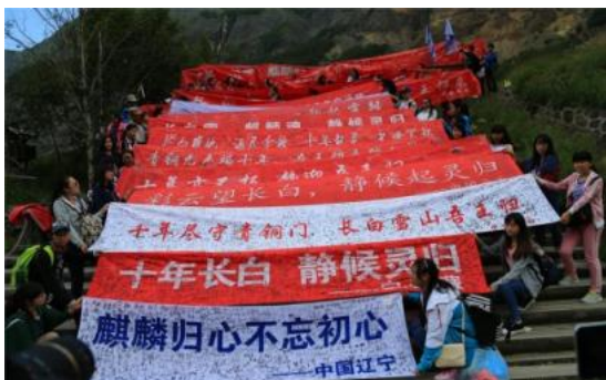
从全国各地汇集而来的读者签名

该小说的忠实读者们从今年 3 月开始，在全国各地发起了“十年长白 静候灵归”的活动，通过网络号召大家在 8 月 17 日当天前往长白山集合。