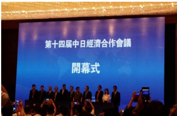
李书记及各位登台发言贵宾

会议伊始，由辽宁省中共党委书记发表了“中央政府、国务院对东北老工业基地的振兴十分重视，获得了以往未曾有过的发展机遇。在这样的背景下，将加强与日本在更广范围内的交流，使之转向更加务实的方向，为日企创造更加优良的投资环境。”为中心的开场问候。