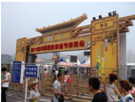
盛装迎客的会场大门

会场中以国内厂家为首，有来自德国、日本等世界三十余国的啤酒生产商云集，提供有近400种各式啤酒可供游客品尝。此外现场除了有各类小吃摊点外，还有舞台表演及啤酒制作体验等活动将整个会场气氛推向高潮。