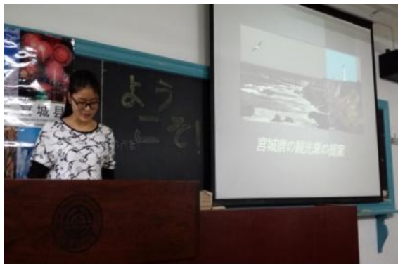
大学生有关“宫城县观光业提案”的讲演

通过同学们的讲演再一次切身感到想要将安全放心的宫城更好的推广出去，需要通过不断推广宣传客观公正的数据才能实现。在此特别鸣谢各位同学的提案。