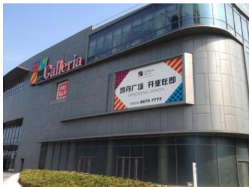
【GALLERIA DALIAN】是继成都后在国内开设的第二家分店

但在进入今年后，不仅有马来西亚系百货商店PACILION（柏威年）在大连站前开设国内首家分店，随着新建的海岸景观区公建设施逐步完善，GALLERIA（凯丹广场）也于大连东港商务区开设了国内第二家分店。此外，配备有市溜冰场的香港系OLYMPIA 66（恒隆广场）也预计在近日于紧邻人民广场的奥林匹克广场附近开门纳客，大连将迎来一个大型商业设施的开门热潮。