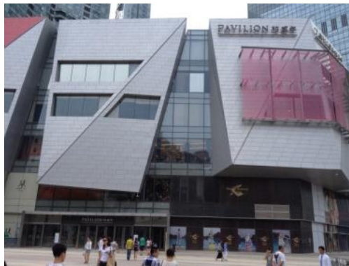
【PAVILION】在大连开设的首家分店内有众多餐厅入驻

大连作为中国百货商店排行榜第二名（2013年度）大商集团的根据地，本地系商业设施的影响力较强，近年来没有新建类似其他中国大城市常见的有魅力的商业设施。