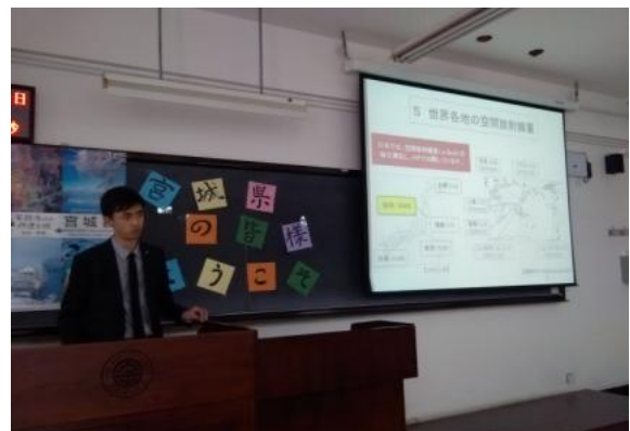
对宫城县及世界各地辐射值进行比较说明

本次的活动主要针对日语系及机械系 1 年级各班学生，由于场地选在各班自有小教室，得以与参会学生就多方面话题进行了亲切交流。