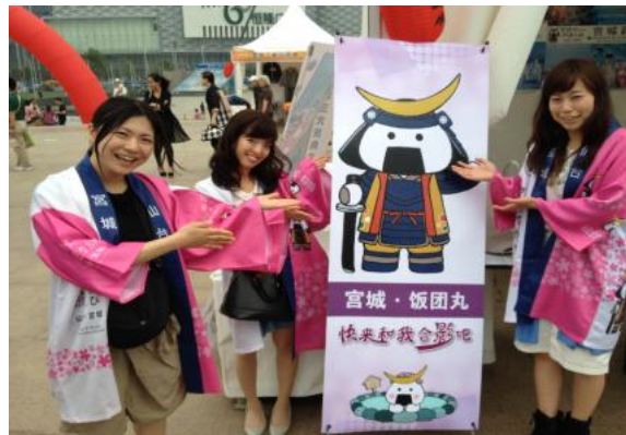
与饭团丸合影留念