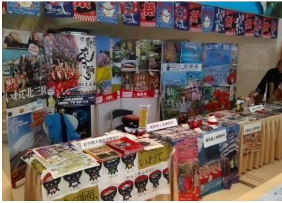
毗邻的东北各县展位