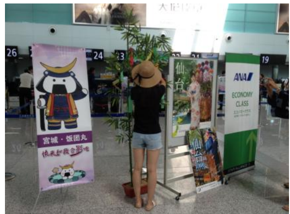
在短笺上记下自己的心愿

在大连机场国际办票柜台前，7月6日（周一）与全日空大连支店，8月6日（周四）与日航大连支店分别共同举办了七夕庆典活动，向前往成田机场的旅客介绍宣传了仙台宫城。